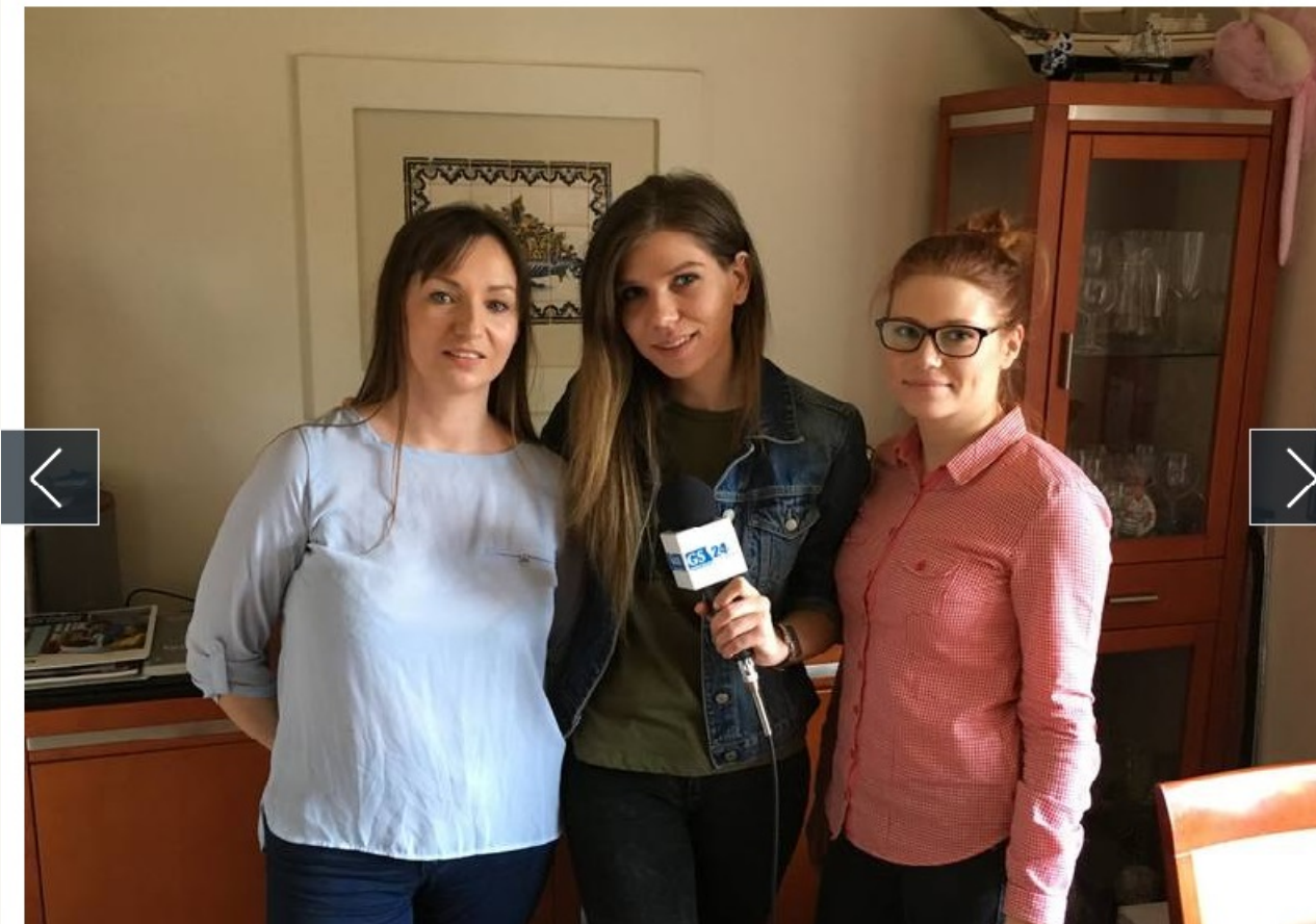
Gotowanie po szczecińsku, 2018